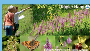
Kugler Hang 4